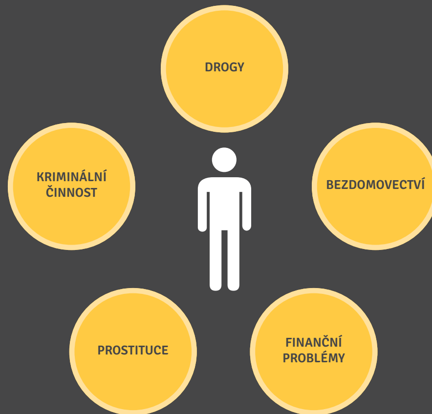
Rizikové chování po odchodu z dětského domova